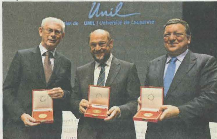
De g. à dr.: Herman Van Rompuy, Martin Schulz et José Manuel Barroso ont été distingués hier soir à l'UNIL.

commerce des vins (CSCV), fait des améliorations», explique le