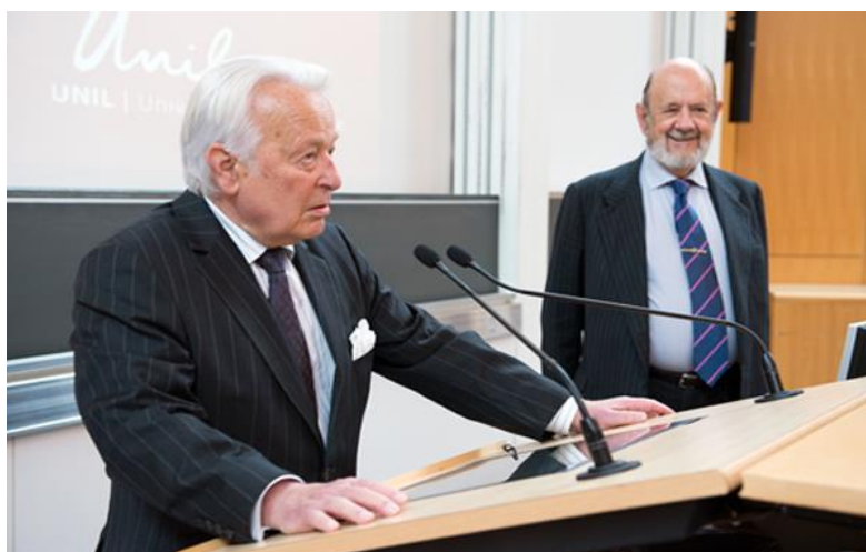
Franz Blankart et José Maria Gil-Robles