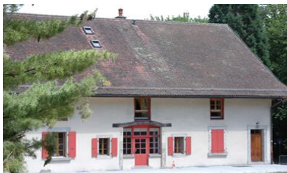
La Ferme de Dorigny, siège de la Fondation

La Fondation a collaboré avec le Centre d'analyse stratégique, qui succède au Commissariat général du Plan, pour les journées du Patrimoine à Paris – septembre 2012