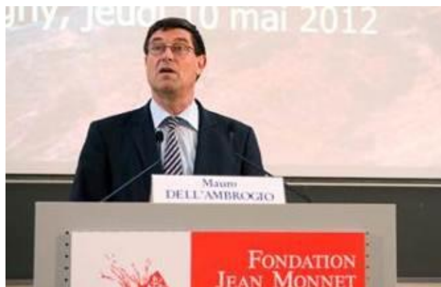
Mauro Dell'Ambrogio, secrétaire d'Etat à l'éducation et à la recherche de la Confédération suisse