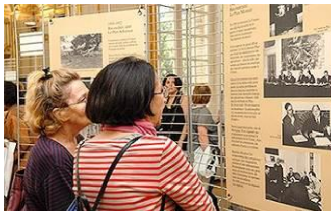
Présentation au public du film et de l'exposition consacrés à Jean Monnet

Les premiers bénéficiaires de la Bourse Henri Rieben sont venus à la Fondation