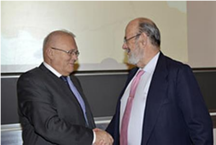
Péter Balázs et José Maria Gil-Robles