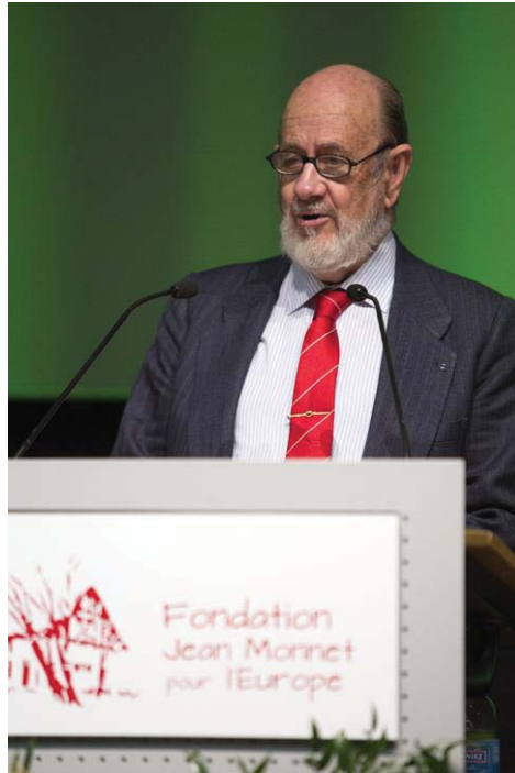
José Maria Gil-Robles, président de la Fondation de 2009 à 2014