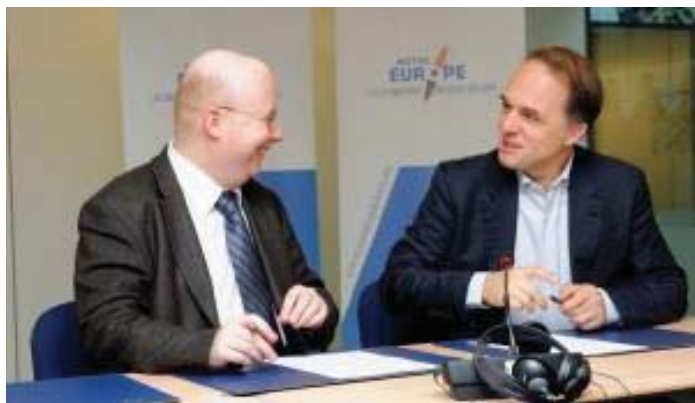
La signature de la convention

Cette photographie met en avant deux personnalités ayant marqué les activités des archives en 2015 : le traitement du fonds photographique de Pierre Uri ainsi que la signature en décembre 2015 d'une convention avec l'Institut Jacques Delors faisant de la Fondation l'un des lieux de consultation des archives personnelles de Jacques Delors en tant que président de la Commission européenne.