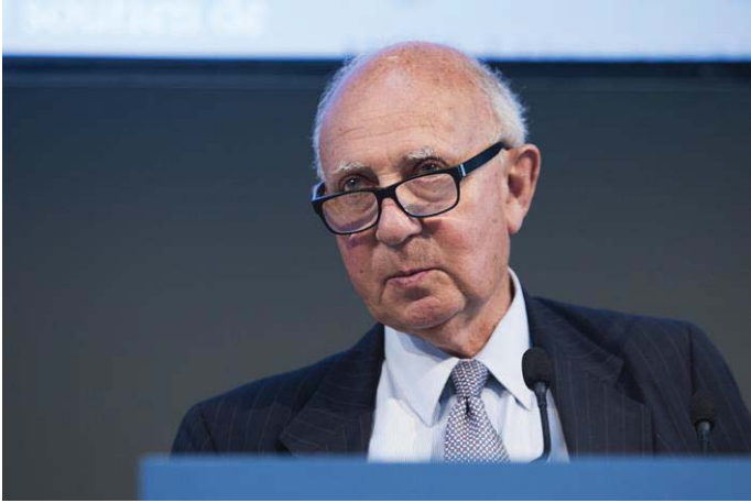
Lord Hannay of Chiswick