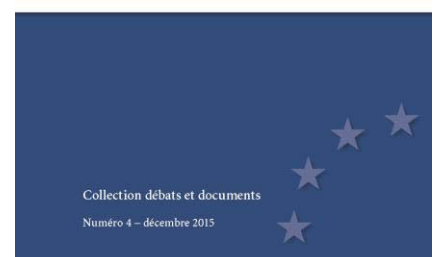
Les trois brochures parues en 2015