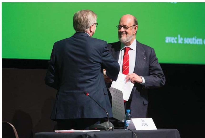
Pat Cox et José Maria Gil-Robles